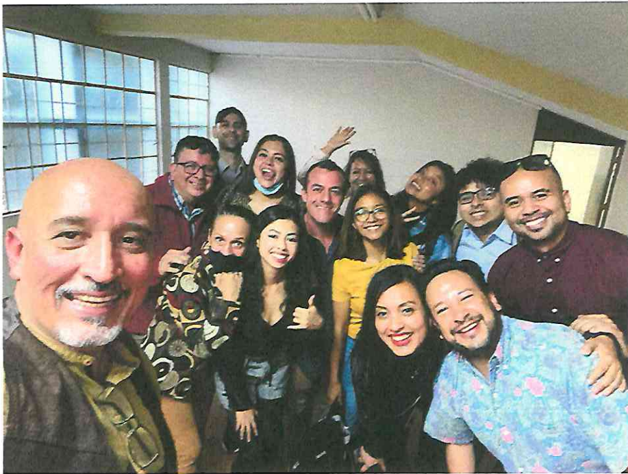
Primera reunión con el elenco e inicio de ejercicios de improvisación e imaginación.