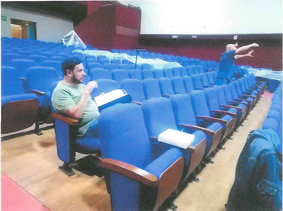
Recopilación de información surgida de ejercicios e improvisaciones.