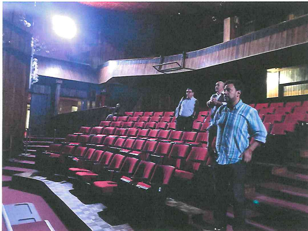
Se acudió a ensayos generales en el Teatro de Cámara para recabar cambios en el libreto final y técnico.